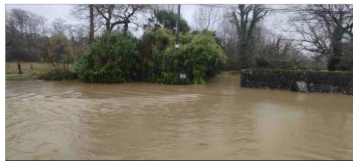
Vue du repère durant la crue (vue sur l'entrée du n°2 de la rue)