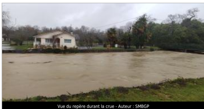
Vue du repère durant la crue

Code : WEB_R_202203220908 Date de mise à jour : 22/03/2022 Auteur : SMBGP