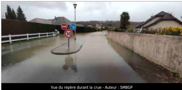
Vue du repère durant la crue - Auteur : SMBGP

GÉNÉRAL Code : WEB_R_202203221944 Date de mise à jour : 07/07/2022 Auteur : SMBGP