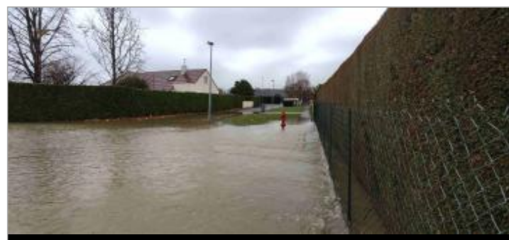
Vue du repère durant la crue (vue vers l'entrée du lotissement)