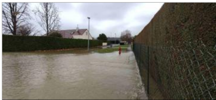
Vue du repère durant la crue (vue vers l'entrée du lotissement)

Type de repérage : Observations en cours d'événement