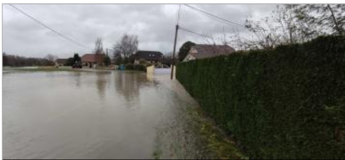
Vue du repère durant la crue