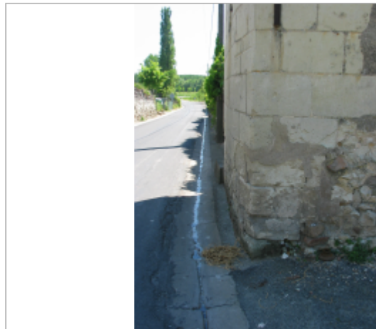
Site Munet à Distre

Coordonnées WGS84 : X: -0.09462770 / Y: 47.22400450