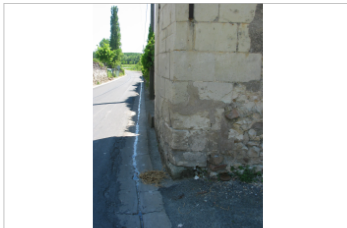
Site Munet à Distre

GÉOLOCALISATION Coordonnées WGS84 : X: -0.09462770 / Y: 47.22400450 Coordonnées RGF93 (Lambert 93) X: 465885.14 / Y: 6685000.03 Coordonnées RGF93 (ETRS89) : X: -0.0946277 / Y: 47.2240045 Code Hydro: L8-0210 Rive de référence: Gauche