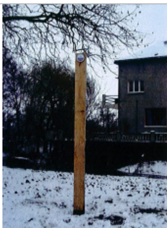
Repere Vaudelnay 1983