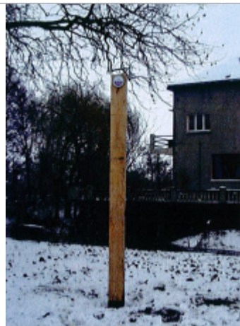
Site de Vaudelnay