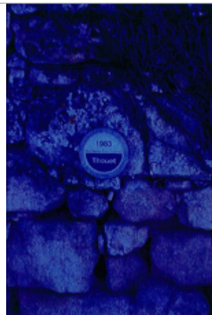
Site chemin des Zionnes 1983