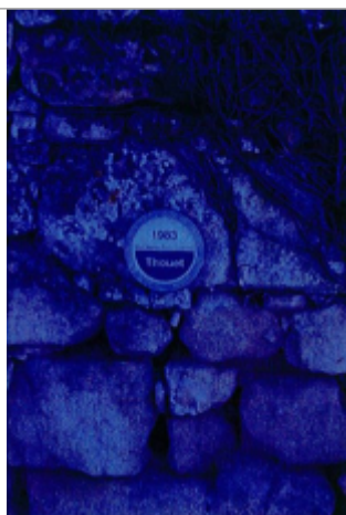
Repere Chace 1983

Altitude calculée de l'eau (en m) : 31.466 m