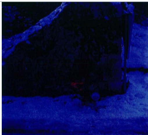
Repere a l'entree du lotissement les Rivières