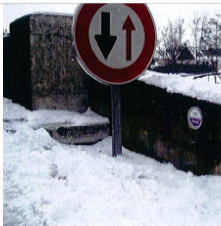
Site Pont de Chace 1983