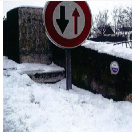
Site Pont de Chace 1983