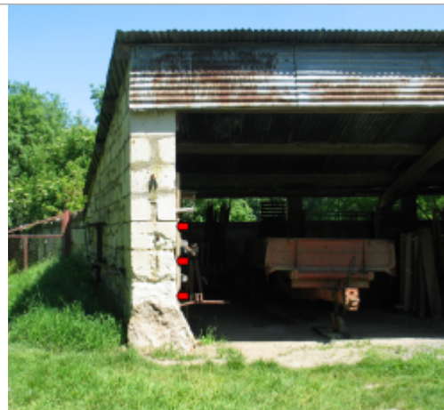
Site Saint-Just à Gastines