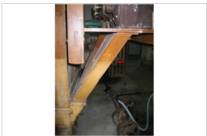
Trace de l'eau et décoloration d'une poutre interieure

MARQUE Maximum de l'inondation : Oui Visibilité : Non État du repère : Bon Pérennité : Moyenne Repère calculé : Non renseigné PHEC : Non renseigné