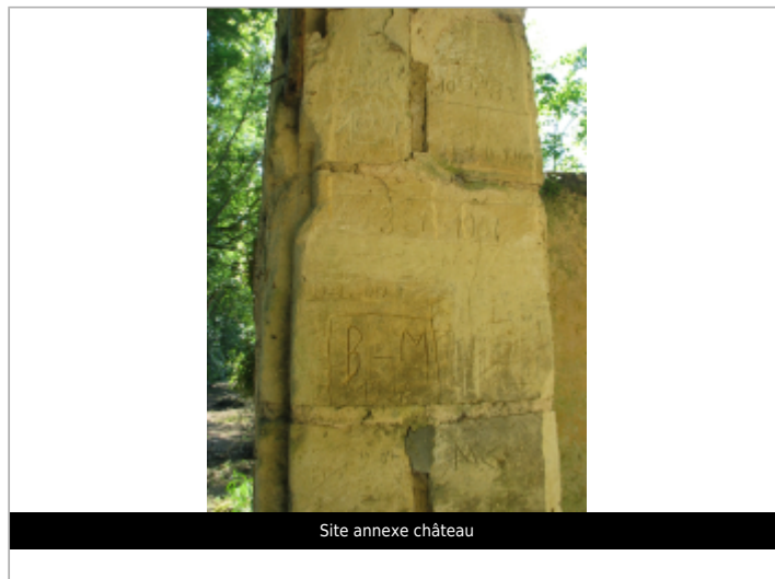
Site annexe château