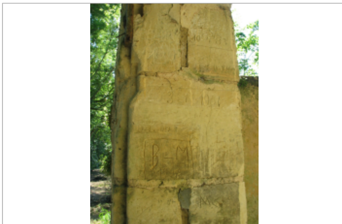
Site annexe château