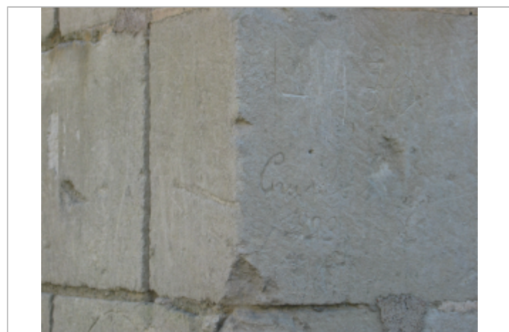
Gravure hauteur 1923