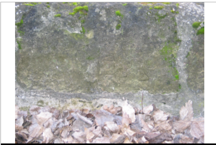
Site Pont de Chace 1983 (Limite sol)

GÉOLOCALISATION Coordonnées WGS84 : X: -0.08039600 / Y: 47.21561900 Coordonnées RGF93 (Lambert 93) : X: 466924.92 / Y: 6684027.2 Coordonnées RGF93 (ETRS89) : X: -0.080396 / Y: 47.215619 Code Hydro: L8-0210 Rive de référence: Gauche