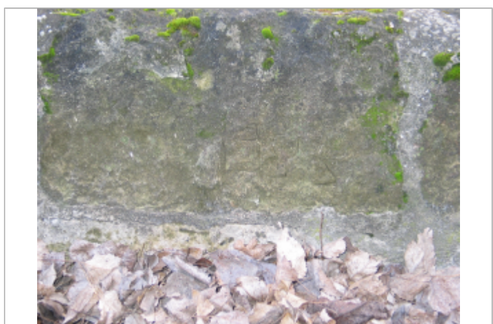
Limite au sol 1983

GÉNÉRAL Code : SAUMUR05_R_14_1 Date de mise à jour : 17/08/2022 Auteur :