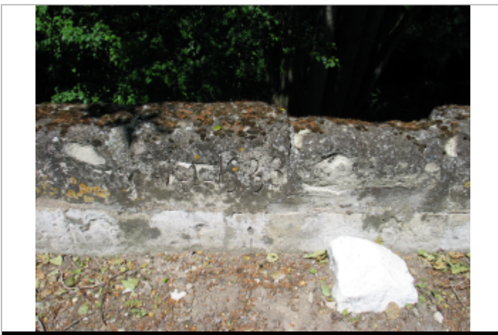
Site Pont de Chace 1936 (Limite sol)

GÉOLOCALISATION Coordonnées WGS84 : X: -0.08064800 / Y: 47.21566700 Coordonnées RGF93 (Lambert 93) X: 466906.07 / Y: 6684033.27 Coordonnées RGF93 (ETRS89) : X: -0.080648 / Y: 47.215667 Code Hydro: L8-0210 Rive de référence: Gauche