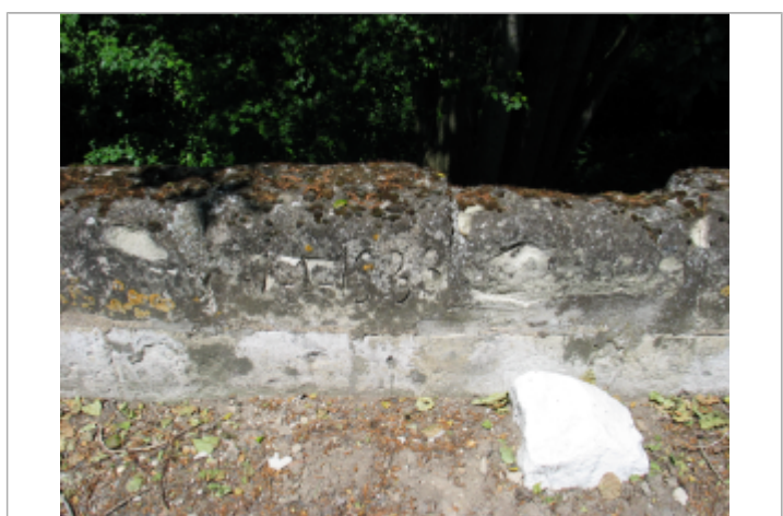
Limite au sol 1936

GÉNÉRAL Code : SAUMUR05_R_11_1 Date de mise à jour : 17/08/2022 Auteur :