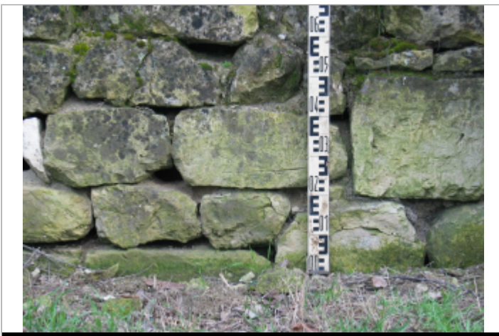
Site chemin des Zionnes 1895 (Limite sol)

GÉOLOCALISATION Coordonnées WGS84 : X: -0.07632500 / Y: 47.21194800 Coordonnées RGF93 (Lambert 93) : X: 467216.91 / Y: 6683607.73 Coordonnées RGF93 (ETRS89) : X: -0.076325 / Y: 47.211948 Code Hydro: L8-0210 Rive de référence: Droite