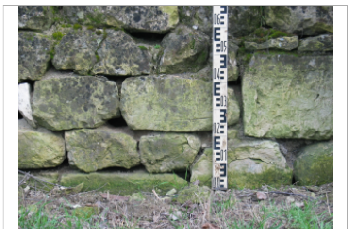
Limite au sol 1895

GÉNÉRAL Code : SAUMUR05_R_7_1 Date de mise à jour : 17/08/2022 Auteur :