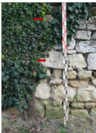
Limite au sol 1910