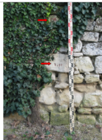
Site chemin des Zionnes 1910 (Limite sol)