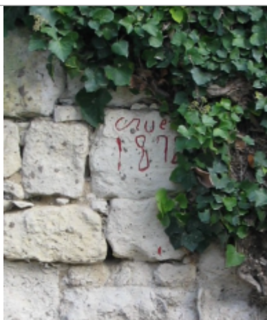
Limite au sol 1872