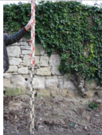
Site chemin des Zionnes 1872 (Limite sol)