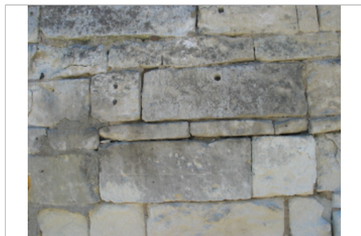
Gravure hauteur 1983