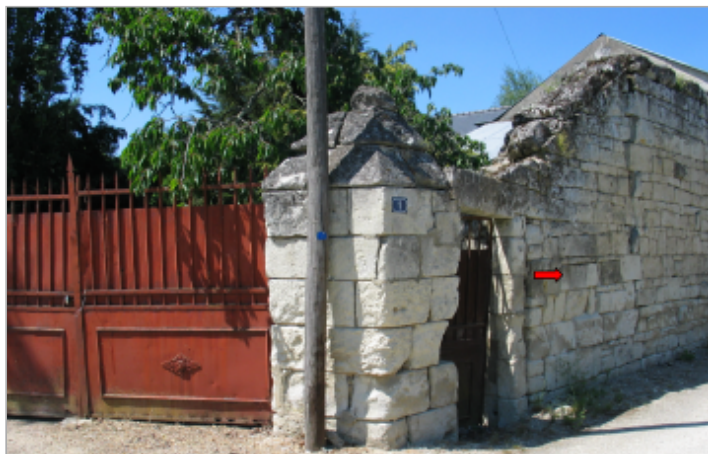
Site Saint-Juste rue principale