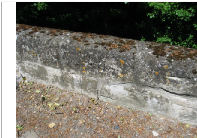
Site Pont de Chace 1923 (Limite sol)

Coordonnées WGS84 : X: -0.08072200 / Y: 47.21566500