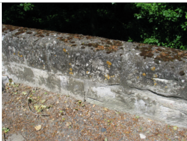
Limite au sol 1923