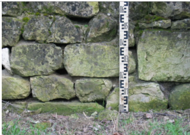
Site chemin des Zionnes 1895 (Limite sol)