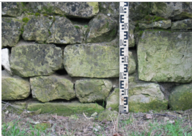
Limite au sol 1895

SOURCE DE REPÉRAGE : RECENSEMENT SAUMUR AGGLOMÉRATION 2005 - 01/03/2012