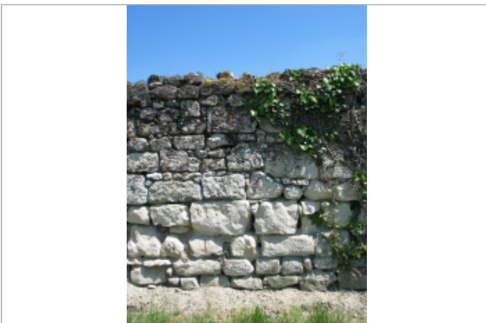
Site chemin des Zionnes 1983 (Limite sol)

GÉOLOCALISATION Coordonnées WGS84 : X: -0.07624300 / Y: 47.21218100 Coordonnées RGF93 (Lambert 93) X: 467224.12 / Y: 6683633.35 Coordonnées RGF93 (ETRS89) : X: -0.076243 / Y: 47.212181 Code Hydro: L8--0210 Rive de référence: Droite