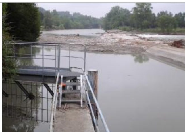
Vue du repère (la trace orange représente le niveau atteint par les eaux)

Altitude calculée de l'eau (en m) : 182.42