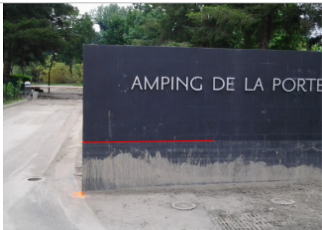
Vue du repère (le trait rouge représente le niveau atteint par les eaux)