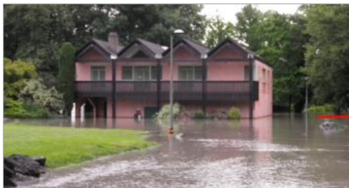
Vue du repère durant la crue