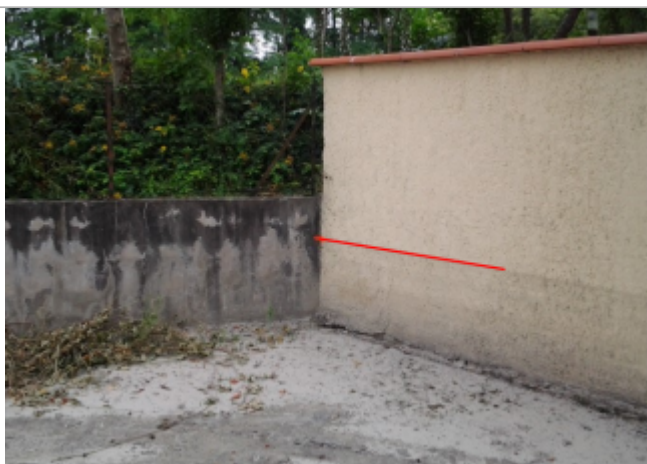
Vue du repère (le trait rouge représente le niveau atteint par les eaux)

Altitude calculée de l'eau (en m) : 251.37