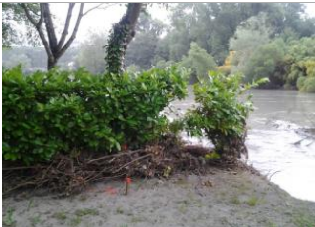
Vue du repère (la trace orange sur l'arbre représente le niveau atteint par les eaux)