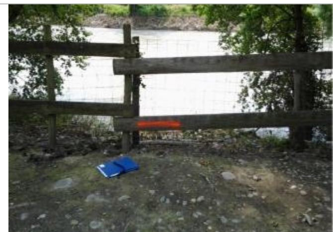
Vue du repère (le trait orange représente le niveau atteint par les eaux)