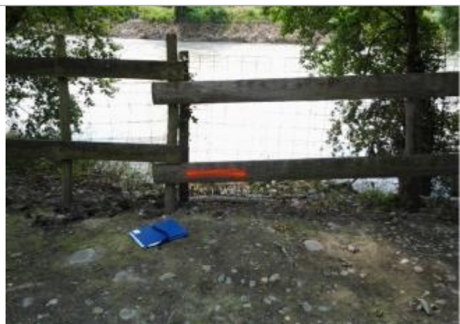
Vue du repère (le trait orange représente le niveau atteint par les eaux)

Altitude calculée de l'eau (en m) : 147.39