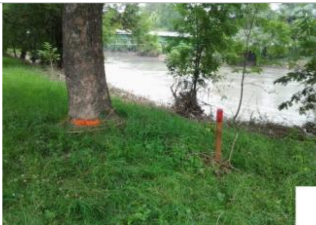
Vue du repère (le trait orange représente le niveau atteint par les eaux)

Altitude calculée de l'eau (en m) : 178.31