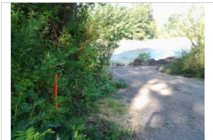
Vue du repère (l'eau a atteint la base du piquet orange)