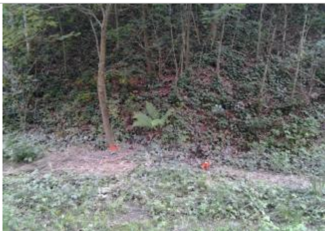
Vue du repère (les marques oranges représentent le niveau atteint par les eaux)