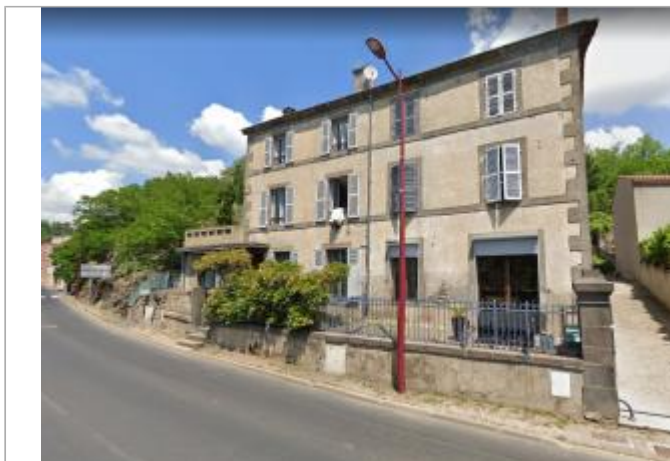
Habitation parcelle 432

Coordonnées WGS84 : X: 3.13251070 / Y: 45.58860500 Coordonnées RGF93 (Lambert 93) : X: 710332.06 / Y: 6498796.75 Coordonnées RGF93 (ETRS89) : X: 3.1325107 / Y: 45.588605 Code Hydro: K2674000 Rive de référence: Gauche