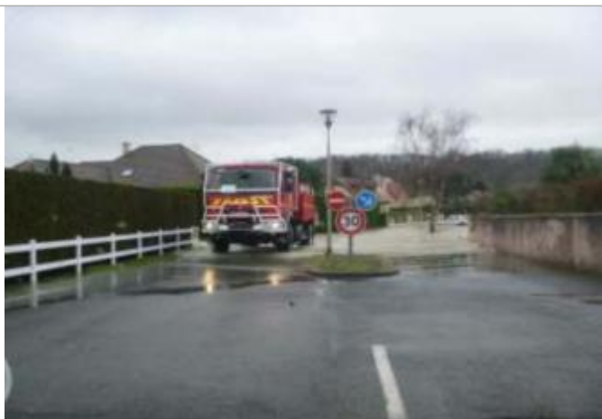
Vue du repère durant la crue

SOURCE DE REPÉRAGE : ENQUÊTE DE TERRAIN ÉLÉMENTS INGÉNIERIES - SAFEGE POUR LA DDTM 64 - 25/01/2014