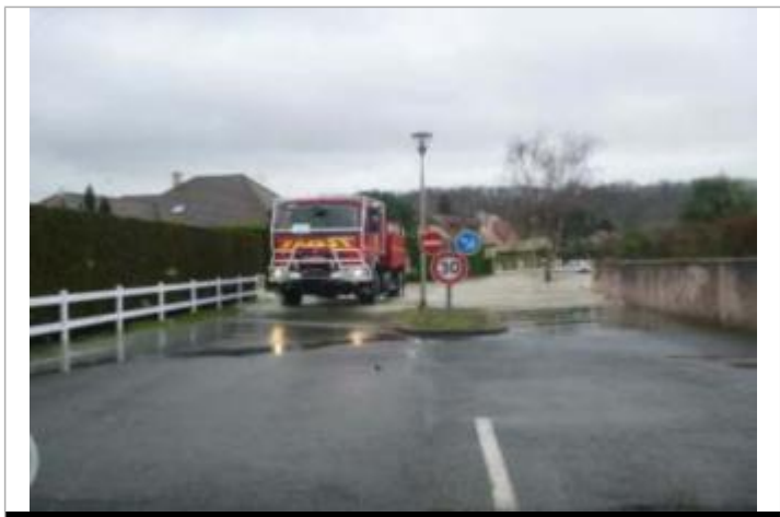
Vue du repère durant la crue

GÉNÉRAL Code : WEB_R_202203174404 Date de mise à jour : 17/03/2022 Auteur : SMBGP