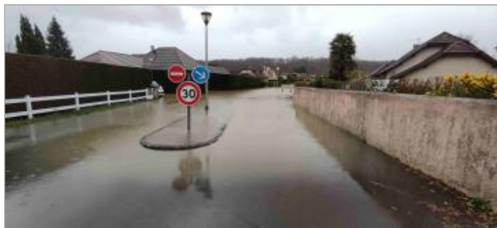
Vue du repère durant la crue