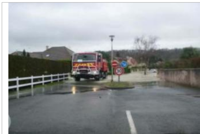
Vue du repère durant la crue

SOURCE DE REPÉRAGE : ENQUÊTE DE TERRAIN ÉLÉMENTS INGÉNIERIES - SAFEGE POUR LA DDTM 64 - 25/01/2014