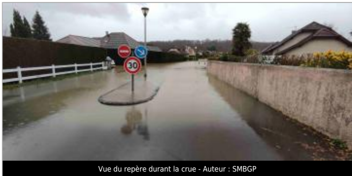
Vue du repère durant la crue

GÉNÉRAL Code : WEB_R_202203221944 Date de mise à jour : 07/07/2022 Auteur : SMBGP