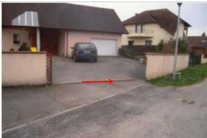
Vue du repère (la flèche rouge représente le niveau atteint par les eaux)

Altitude calculée de l'eau (en m) : 203.07 m