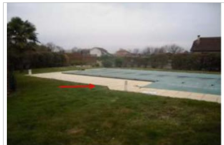
Vue du repère (l'eau a atteint le pied de la terrasse de la piscine)