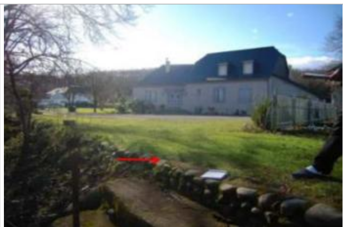
Vue du repère (la flèche rouge représente le niveau atteint par les eaux)

Altitude calculée de l'eau (en m) : 210.43