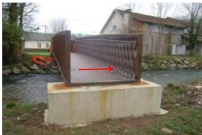
Vue du repère (le flèche rouge représente le niveau atteint par les eaux)

Référence nivelée : Marque d'inondation Système altimétrique : NGF IGN 1969 (système normal) Altitude de la référence (en m) : 208.330 m Altitude calculée de l'eau (en m) : 208.33 m