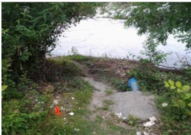
Vue du repère (l'eau a atteint le pied du piquet orange)

Altitude calculée de l'eau (en m) : 195.6