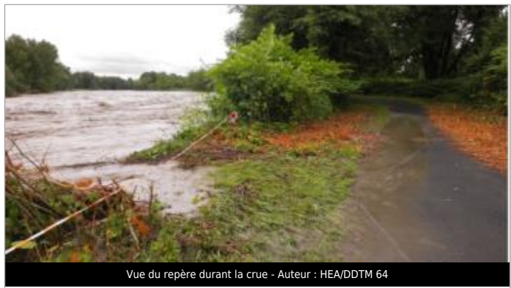
Vue du repère durant la crue

GÉNÉRAL Code : WEB_R_202203174829 Date de mise à jour : 17/03/2022 Auteur : SMBGP