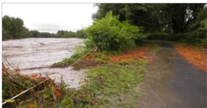
Vue du repère durant la crue