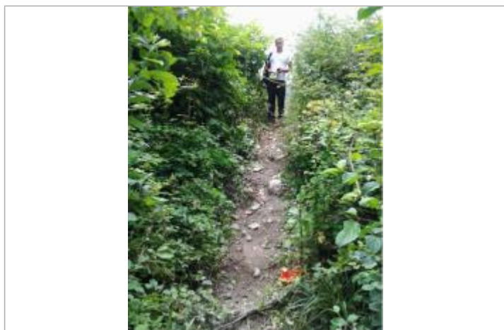
Vue du repère (l'eau a atteint le pied du piquet orange)

Maximum de l'inondation : Oui Visibilité : Non renseigné État du repère : Disparu Pérennité : Aucune Repère calculé : Non PHEC : Non renseigné