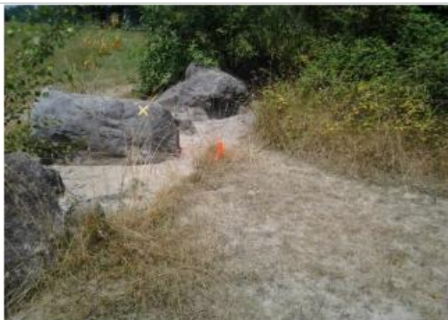
Vue du repère (l'eau à atteint le pied du piquet orange)