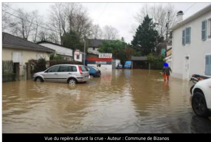
Vue du repère durant la crue - Auteur : Commune de Bizanos

SOURCE DE REPÉRAGE : ENQUÊTE DE TERRAIN ÉLÉMENTS INGÉNIERIES - SAFEGE POUR LA DDTM 64 - 25/01/2014