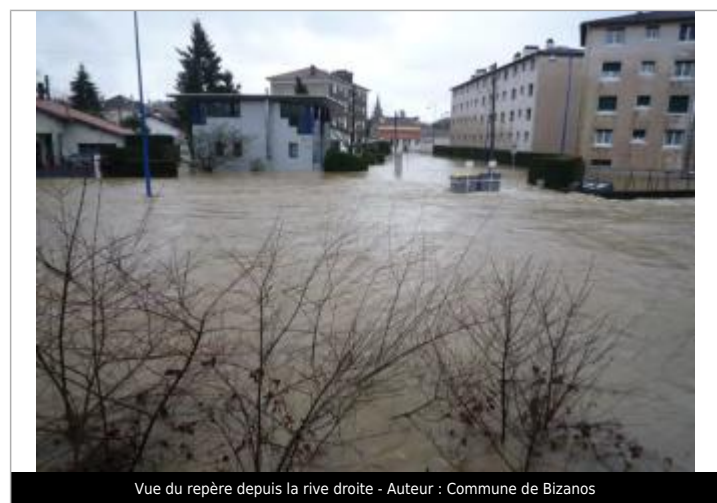
Vue du repère depuis la rive droite