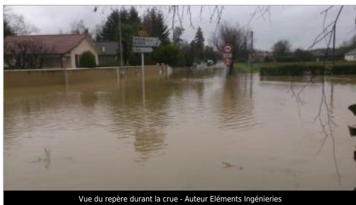
Vue du repère durant la crue - Auteur Eléments Ingénieries

Code : WEB_R_202203171026 Date de mise à jour : 17/03/2022 Auteur : SMBGP