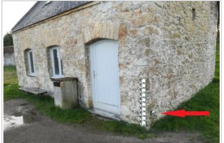
Petit bâtiment près de la chapelle Saint-Philibert

GÉOLOCALISATION Coordonnées WGS84 : X: -2.99793290 / Y: 47.58498940 Coordonnées RGF93 (Lambert 93) X: 249607.46 / Y: 6737626.43 Coordonnées RGF93 (ETRS89) : X: -2.9979329 / Y: 47.5849894 Code Hydro: Q0000630 Rive de référence: