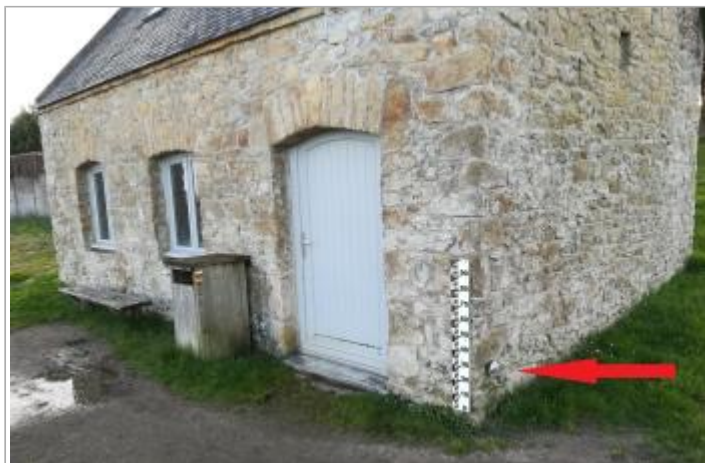
Petit bâtiment près de la chapelle Saint-Philibert