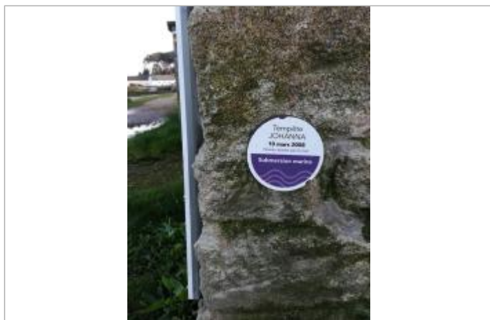
repère normalisé de la submersion marine du 10 mars 2008 - Tempête Johanna

SOURCE DE REPÉRAGE : SPC VILAINE COTIERS BRETONS - 08/12/2016